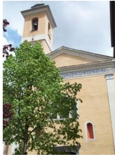
Chapelle des Pénitents Blancs

Isolée entre St Dalmas et La Roche, la chapelle St Joseph accueille chaque 1 er Mai le « Patroucino », réunion des trois confréries pénitentes de Valdeblore. Cette manifestation se tenait autrefois à la chapelle de la Trinité, détruite lors de la construction de la route.