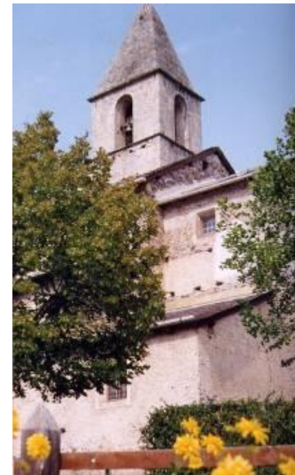
Église Saint Jacques le Majeur