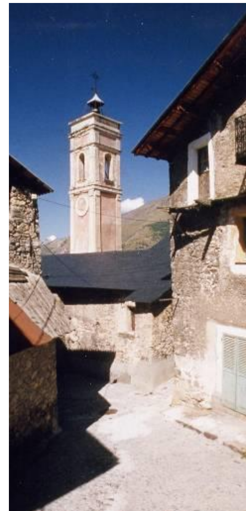
La Roche Chapelle de l'Annonciation.

Saint Jean Baptiste est fêté le 24 juin. Il vécut au 1 er siècle de notre ère. C'est le précurseur du Christ. On dit de lui que parmi ceux qui sont nés de la femme, il n'y eut jamais de plus grands que Jean-Baptiste. Il prêcha la venue du Christ sur terre et l'on entendait sa voix jusqu'au fin fond du désert. Lorsque le Christ arriva, il le baptisa à sa demande, dans les eaux du Jourdain, puis il le suivit. Il mourut décapité dans la ville de Machéronte en Pérée.