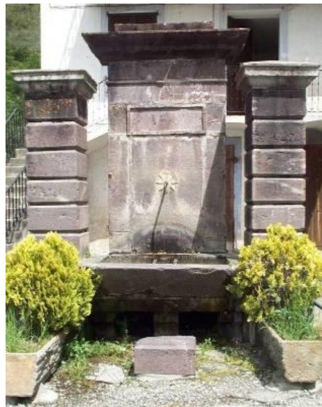
Fontaine de La Bolline

A droite enfin, le chemin du Portalet qui contourne le village et le vieux lavoir où sur le rythme des battoirs on apprenait les « leris ». La route à gauche amène à la « Fuount Luegno », première fontaine du village, et de là, vous découvrez l'église Ste Croix.