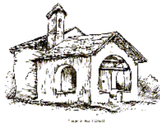
Chapelle St Donat à La Bolline