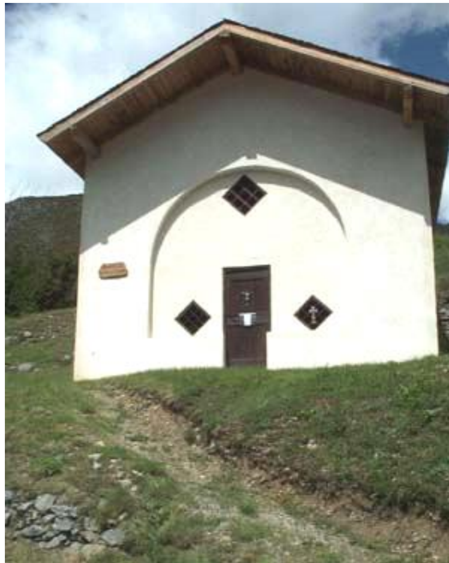
Chapelle St Joseph

À noter également les deux bénitiers de l'entrée et la statue de St Donat.