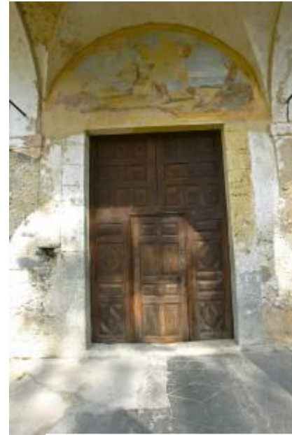
Église Ste Croix

La tradition était de se rendre à St Donat pour invoquer le saint en vue d'obtenir une faveur. Une famille de Marie sur Tinée qui avait un petit garçon aveugle, décida d'aller à St Donat pour qu'il fasse quelque chose pour leur fils. Quand ils arrivèrent à Bonfillon, le rocher en face St Donat, il s'est mis à pleuvoir et le petit dit : « Oh ! Papa, mama, es avasso San Dounat ? Oh ! coumo's bello, coumo's bello, bello, bello ! vé un bel santo ! coumo's bello ! » Les parents heureux de constater la bonté de St Donat, s'en retournèrent, mais avant d'arriver à Marie, le petit était à nouveau aveugle.